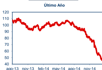
Precio del Petróleo

De acuerdo a las estimaciones de Econsult, de mantenerse el tipo de cambio en los niveles actuales, el precio promedio de las gasolinas disminuiría $22 y el del diésel bajaría cerca de $29 durante la semana que comienza el 23 de enero del 2015. Cabe destacar que de no estar funcionando el Mepco los precios de las gasolinas caerían $34 y el del diésel $49.