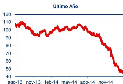
Precio del Petróleo

De acuerdo a las estimaciones de Econsult, de mantenerse el tipo de cambio en los niveles actuales, el precio promedio de las gasolinas se mantendría cercano a los niveles actuales y el del diésel subiría cerca de $2 durante la semana que comienza el 5 de febrero del 2015. Cabe destacar que de no estar funcionando el Mepeco los precios de las gasolinas subirían $3 y el del diésel $2.