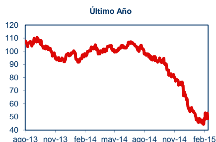
Precio del Petróleo

De acuerdo a las estimaciones de Econsult, de mantenerse el tipo de cambio en los niveles actuales, el precio promedio de las gasolinas se incrementaría $8 y el del diésel subiría cerca de $16 durante la semana que comienza el 19 de febrero del 2015. Cabe destacar que de no estar funcionando el Mepeco los precios de las gasolinas subirían $34 y el del diésel $36.