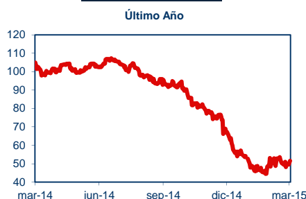
Precio del Petróleo

De acuerdo a las estimaciones de Econsult, de mantenerse el tipo de cambio en los niveles actuales, el precio promedio de las gasolinas se incrementaría $8 y el del diésel subiría cerca de $5 durante la semana que comienza el 12 de marzo del 2015.